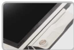
Lecteur clé Dallas Et Carte Magnétique