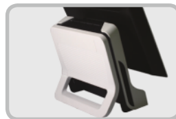
Design Moderne De l'Arrière du PC